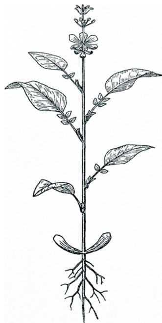
Abbildung 1: Illustration zu Goethes Metamorphose der Pflanzen (von Wilhelm Troll 1926)